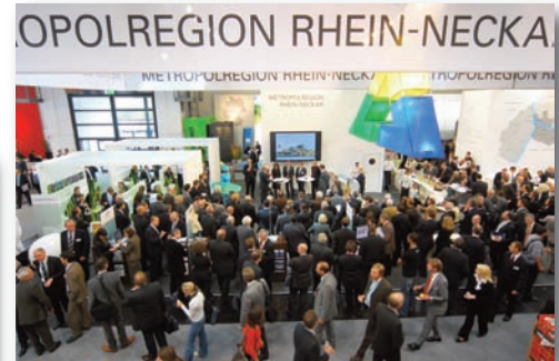
Der Messestand der Metropolregion - stets gut besucht.