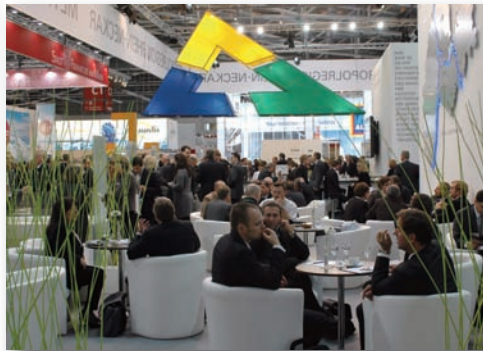
Blickpunkt, Anziehungspunkt, Ruhepunkt - der neue Auftritt der Metropolregion (Bild unten).