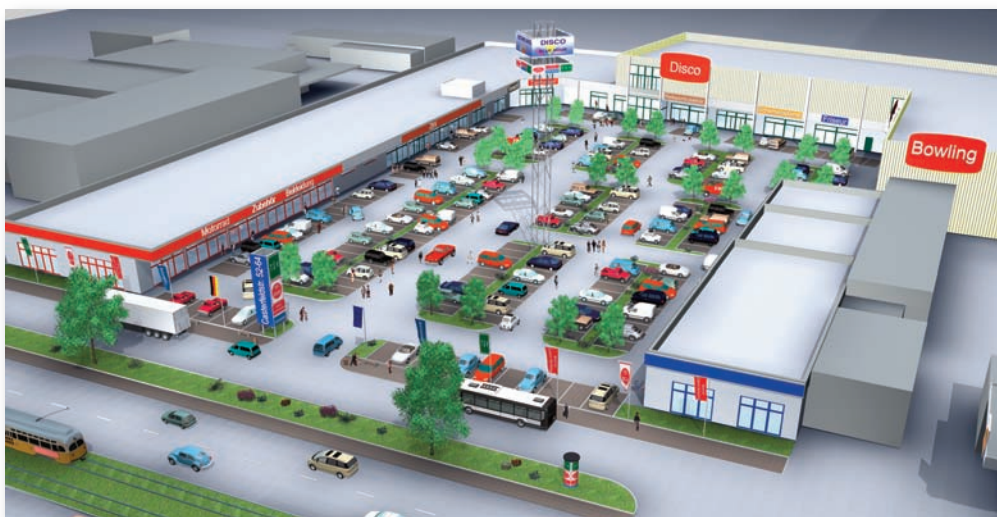
Das zukünftige Fachmarktzentrum Casterfeld